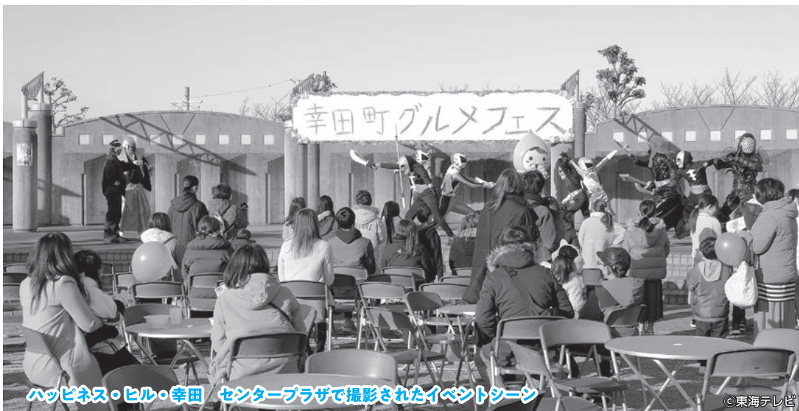
ハッピーネス・ヒル・幸田 センタープラザで撮影されたイベントシーン

ハッピーネス・ヒル・幸田のセンタープラザで行われたロケでは、ドラマの重要シーンが撮影されました。