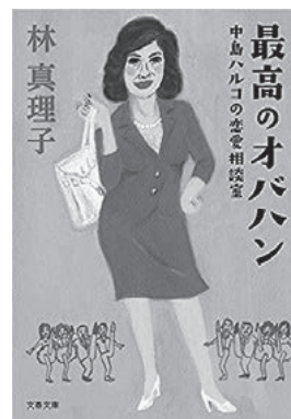
林真理子 「最高のオバハン」シリーズ (文春文庫)

土ドラ史上・最強のスーパーレディが世の悩みや不正をなぎ倒す！ 痛快毒舌エンターテインメント、開幕！