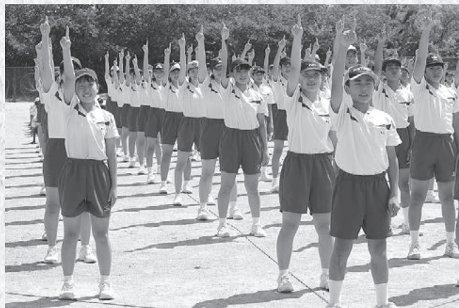
↑全校ダンスの練習風景

縦割り団活動も始まり、5つの団に分かれて3年生を中心に活動しています。全校ダンス「ライジングサン」の練習で