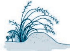
↑シナダレスズメガヤ

*生態系被害防止外来種とは 特定外来生物被害防止法による規制の対象外であるが、日本国内で生態系や、農林水産業に悪い影響をおよぼす恐れのある生物