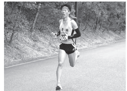
↑昨年2区住原選手 区間賞を受賞