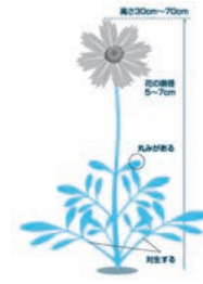
↑オオキンケイギク