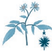
↑アメリカセンダングサ

オオキンケイギクのほかにも、生態系被害防止外来種*であるアメリカセンダングサやシナダレスズメガヤなどの外来種も町内に繁殖しています。駆除のご協力をお願いいたします。