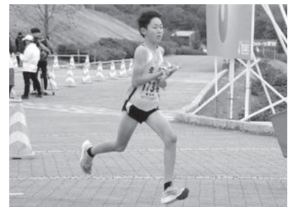
↑昨年6区市川選手 区間賞を受賞