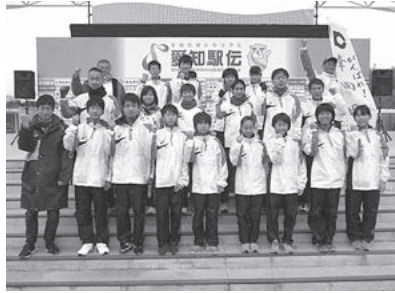
↑昨年の出場選手団「町村の部第3位」を受賞