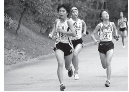
↑昨年1区山川選手 区間賞を受賞