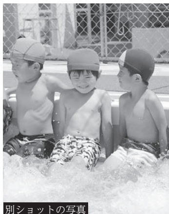
別ショットの写真