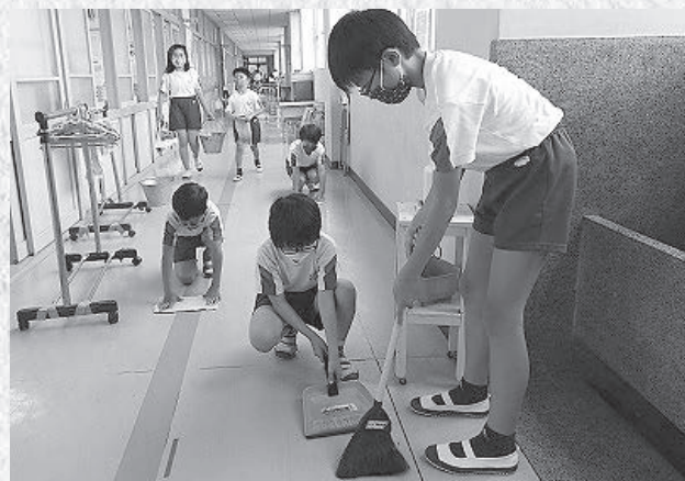
↑みんなで協力して学校をきれいにするよ

本年度も、清掃活動では高学年が中心 となって、低学年の子どもたちに掃除の 仕方を教えています。「廊下の隅まで掃 くときれいになるよ」「もうすぐ時間にな るから、ごみを集めよう」など積極的に 声を掛けている姿を見掛けます。また、 落ち葉で竹箕 ちかみ がいっぱいになると、「重 いからぼくが持って行くよ」と言って、 高学年の子どもが進んで運んでいます。 それは、成長していく中で、お世話をさ れる側からする側になる経験をどの子も しているからだと感じます。このような