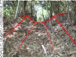
⑤山中に残る地割れ