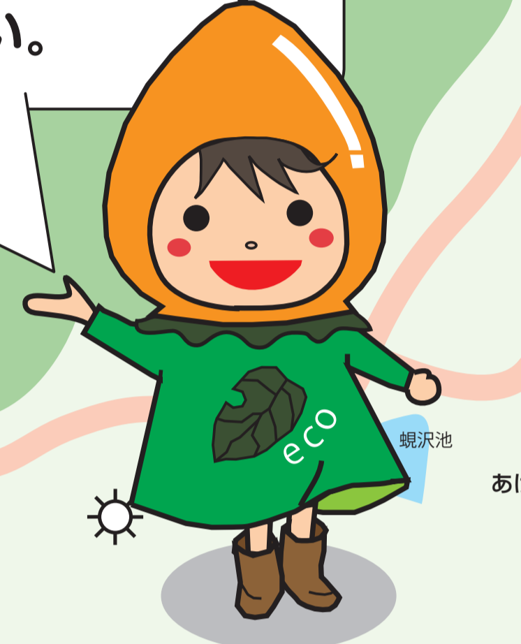
幸田町 環境と都市交通 イメージキャラクター 「えこたん」

幸田町が設定している4つの自転車走行ルートのひとつです。道の駅を経由し広田川沿線を走行するルートになっています。コース周辺の施設や史跡などにも、ぜひお立ち寄りください。