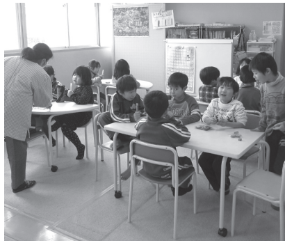
▲利用希望の増加にこたえるため、児童クラブを追加