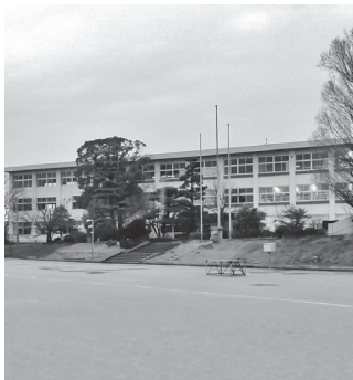
▲全国でも数少ない人口増加が見込まれる町