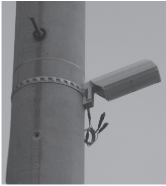
▲町内すべての防犯灯をLED化