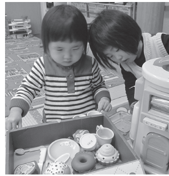
▲児童館の全小学校区設置にむけた構想の作成