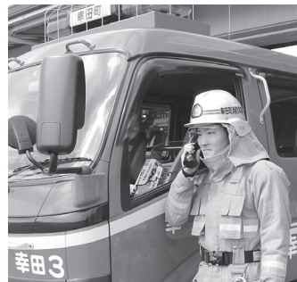
▲デジタル化により大規模災害時の連携や、情報の安全性を高めます。