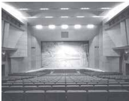
町民会館さくらホール