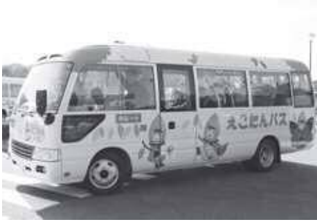
コミュニティバス(えこたんバス)

・地域安全ステーション運営 ・防犯カメラ設置 ・コミュニティバス運行 ・防犯灯設置