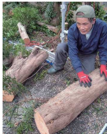
粗大ごみ基準にした樹木

主な整備計画は、カフェ施設を公募し、事業者負担で建設していく。(令和4年開業予定)