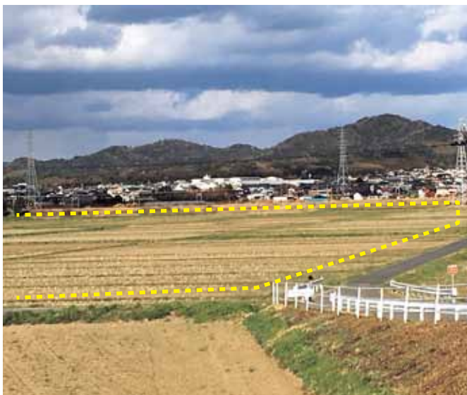
菱池遊水地の予定地