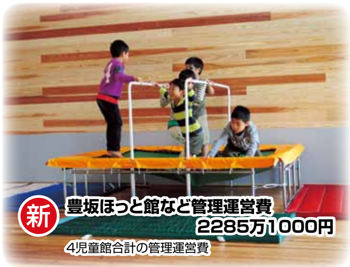
新 豊坂ほっと館など管理運営費 2285万1000円 4児童館合計の管理運営費