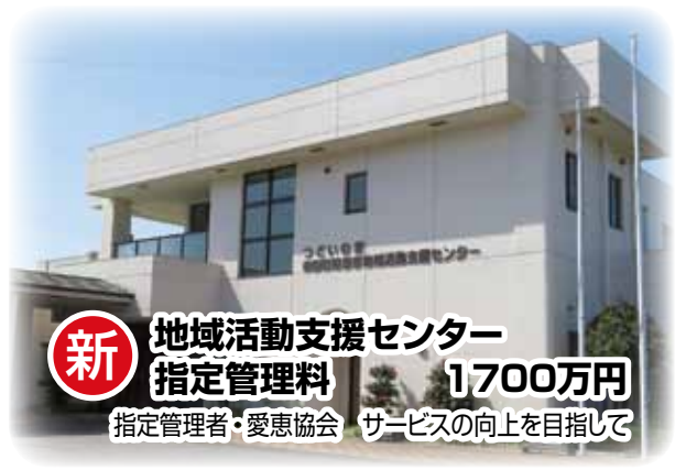
新 地域活動支援センター 指定管理料 1700万円 指定管理者・愛恵協会 サービスの向上を目指して