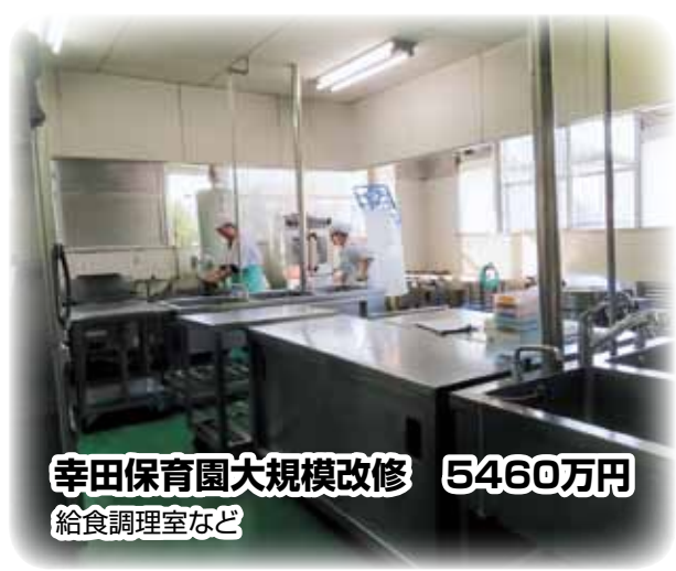
幸田保育園大規模改修 5460万円 給食調理室など