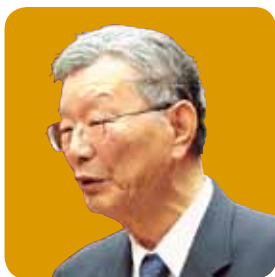
中根 久治 議員