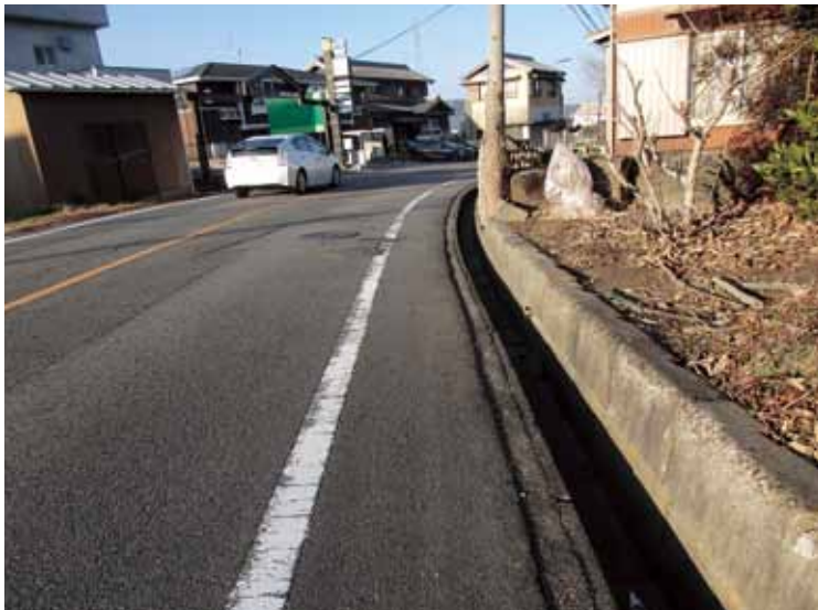
有蓋化が求められる側溝（岩堀区）

問 道路の側溝にふたがないため、自転車に乗る児童が転倒・落下してケガする事例が発生。町道の安全確保のため、有蓋化促進と維持管理を問う。 答 町道の無蓋側溝の把握は。 問 建設部長 現在、把握はできていない。 答 岩堀交差点から横落方面に向う町道の有蓋化を、老朽化して危ないと判断される現場であれば、