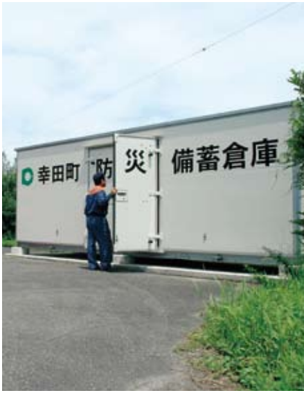
坂崎小学校に平成19年度設置