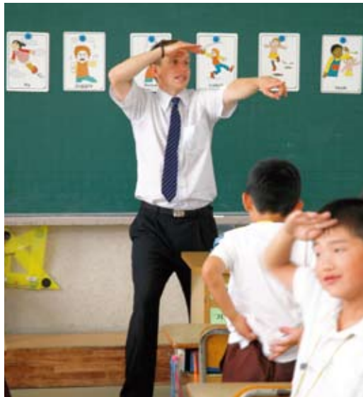
深溝小学校での外国語授業

(4) 高齢者の健康づくり対策は。 (3) 緊急通報装置の設置、配食サービスを週3回実施し、高齢者の実態把握に努めている。 (4) 特定高齢者という形で運動機能、栄養改善、口腔機能向上の3つのプログラムを推進している。 答 健康福祉部長 (1) 地域包括支援センターを中心に、地域密着型の介護サービスを提供する。 (2) 町独自の施策は、おこ