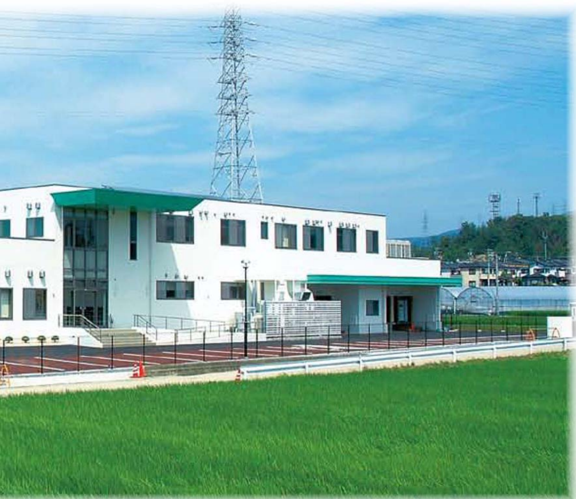
7月22日に竣工した学校給食センター