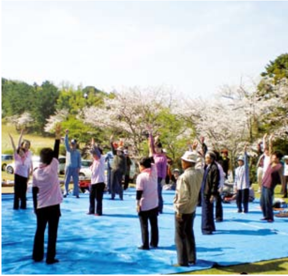
いきいきサロンでハート体操

Q 30分500円の理由は、1時間の半額ではなく、拘束時間、ガソリン代などを考慮した利用料設定とした。