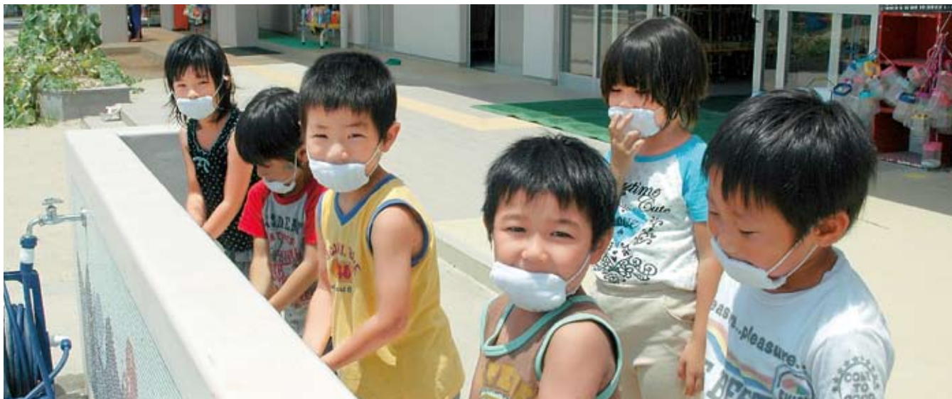
菱池保育園でしっかり手洗いする子どもたち

答 健康福祉部長 (1) 現在、発熱相談センターへの案内、ホームページ、回覧などで周知している。 (2) 発症した時点で、連絡を受け、県に報告をする。 (3) その時点で判断する。 (4) 基本の手洗い、マスク着用、うがいを徹底する。 (5) 十分な休養も必要と考える。 教育長 (6) 情報の公開は一切ない。 (7) 万全な体制を整えていく。 校内で差別が起きないよう校長会で通達した。 健康福祉部長 (7) 万全な体制を整えていく。