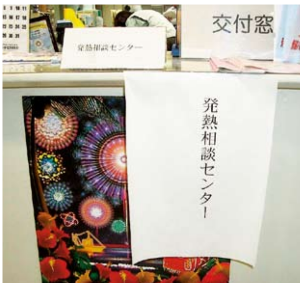
西尾保健所の発熱相談センター

問 国内感染者が拡大し、不安、混乱が続いている。本町の対策を問う。 (1) 窓口の健康課の対応と広報、防災無線、広報車での周知方法は。 (2) 保育園、小、中学校と行政の連絡体制は。 (3) 公共施設の利用、閉鎖は。 (4) 接触、飛沫感染の予防方法と対策は。 (5) 家庭での対応は。 (6) 風評被害が心配であるが情報公開は。 (7) 秋口から大流行の恐れがある。患者急増にどう対応するのか。