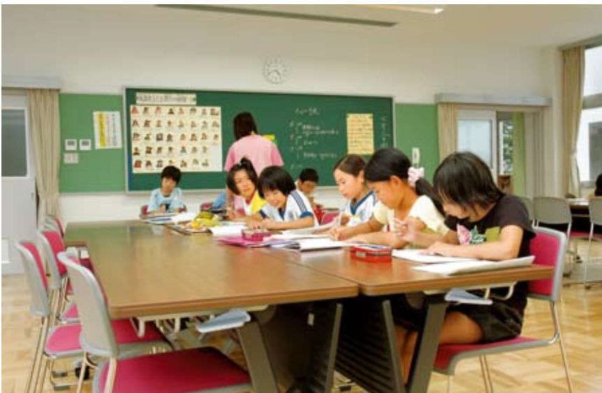
幸田小学校の放課後子ども教室