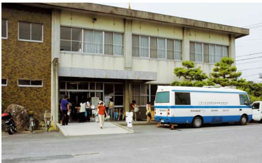
鷺田公民館で住民健診

問 地域集会施設整備費負担が、2年前「行革」の名で、町から地元へ責任転嫁し、町負担などを大幅に削減した。 地域集会施設のカーテン、机、イス、カーペット、エアコンなどの備品等整備はすべて地元負担。 その費用は大きく整備に