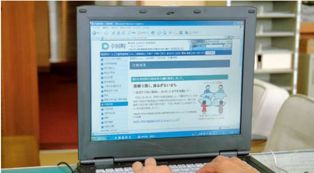
ホームページで情報発信

(3) 積極的にホームページなど活用して発信する。区長会には、必要に応じて情報提供をしていく。