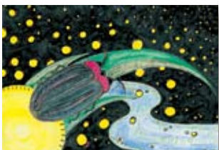
イラスト:牧野次男さん(芦谷)

ホタルは、きれいな川にしかいないので、拾石川の環境を守る会の人に感謝したいです。