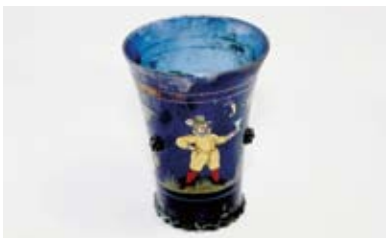
出土したガラス製のグラス

答 教育部長 (1) 所有者の同意を得て、町の文化財指定をし後世に伝えていく。県・国の指定にも取り組んでいきたい。(2) 郷土資料館で修復、保存し、人的配置も準備、検討していく。