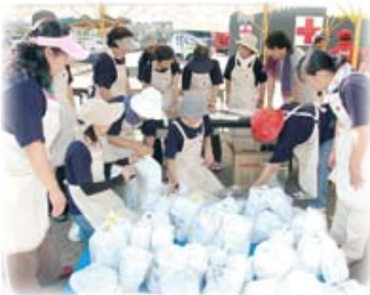
非常食などの配給訓練