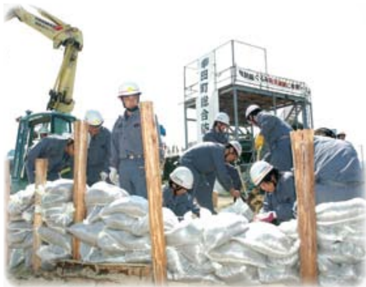
消防団による道路復旧訓練