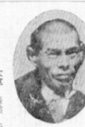
大草 農業 新

一、明るい豊かな町造り。二、二級河川の新設、促進。三、道路橋梁河川の拡充強化。四、農業基本法の実施について。五、遠征家開発並びに林道充実。六、文教施設の充実。七、工場誘致