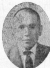
岩堀 農業 現

一、町独自の総合開発計画、都市計画に依る大幸田町建設を理想として邁進する。二、地方自治体の基盤である執行権、議決権の分野を明確にし互に侵す事なく各々の立場