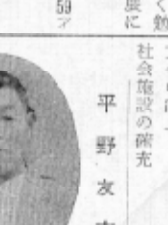
高岡 農業 現