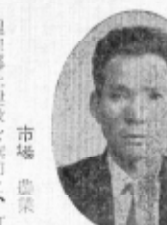
野母 農業 新

理想郷土建設を旗印に、町民の要請を町政に反映させ、これが実現の為最大の努力を払い、新町建設十ヶ年計画に即応した町の諸施設を推進し、豊かな明るい町造りと人垣の為に全力を傾けて幸田町発展に役立ちたい。