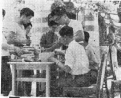
(来幸した移動図書館)

去る七月六日愛知県移動図書館(いすみ号)は、町中央公民館を始め各分館へ巡回した。