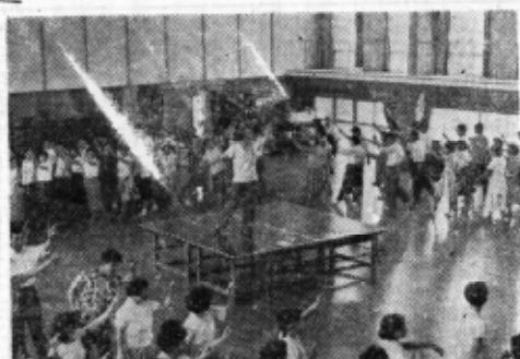
講師を囲んで和かに

今年も盆踊りの講習をうけて来た人を輪の中に入れてみんなたのしく踊りましょう。隣の部落に負けないようにみんなそろつて踊りましょう。