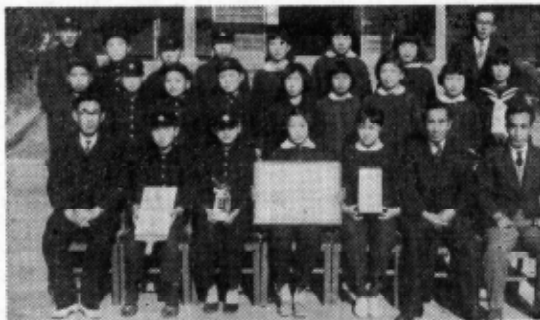
(表彰状を囲んで=幸小子ども銀行)

幸田小学校児童で組織する「菱池子供共同組合」及び「大草子供協同組合」は、このほど優良子ども銀行として愛知県貯蓄推進委員会々長の表彰を受け、去る十二月八日西三河事務所において行われた表彰伝達式に代表者が出席し、西三河事務所長より栄誉ある表彰状等を受けた。同子ども銀行は、菱池農協地区、大草農協地区より在学する