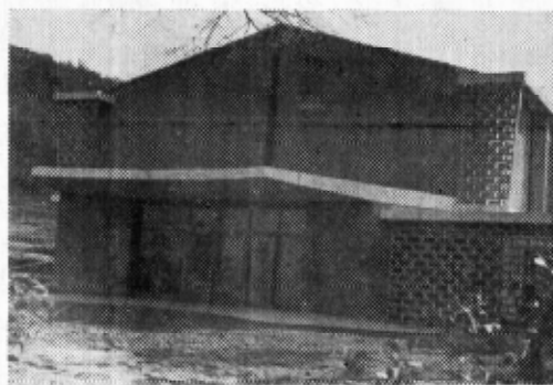
豊坂小学校体育館北西より撮影す

待望の体育館が竣工致し、その堂々たる姿を添えて、豊坂小学校の景観はとみに改まつてまいりました。顧みれば、先年以來の豊坂校区