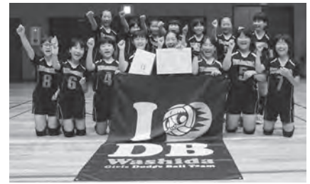
↑女子の部準優勝 鷺田子ども会