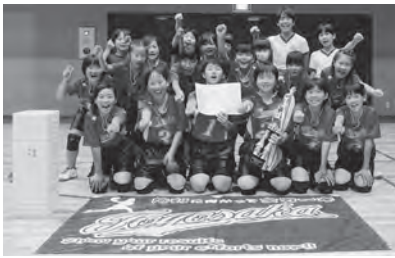
↑女子の部優勝 豊坂学区子ども会

結果は、女子の部優勝が豊坂学区子ども会、男子の部優勝が大草子ども会でした。優勝した2チームと女子の部準優勝の鷺田子ども会は、9月14日㊤に刈谷市体育館で開催される西三ドッジに幸田町代表として出場します。