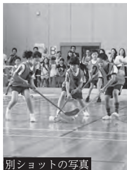
別ショットの写真