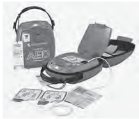
AED本体と収納ケース

AEDの使用方法は簡単で、音声ガイドやイラストに従って操作できるようになっています。必要になった時に、その場にいる誰もが使えます。AED収納ケースを開き、本体のふたを開けると自動的に電源が入ります。以降は、AEDの音声ガイドやイラストに従って操作してください。