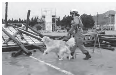
↑災害救助犬の検索