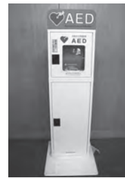
②AED収納ケース + 収納ボックス

町内のAED設置施設は、町ホームページの「救急・消防」⇒「お知らせ」⇒「幸田町内AED設置施設」から確認できます。町内、町外にあるAEDを探す場合「あいちAEDマップ」ホームページからも確認できます。