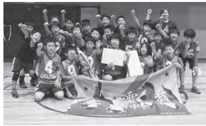
↑男子の部優勝 大草子ども会