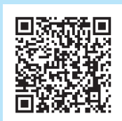
幸田町手話動画ページ

5月から町のYouTube公式アカウント「幸田町タウンプロモーション」で「幸田町手話動画」を配信しています。耳の聞こえない人に向けて、手話で情報をお届けしています。毎月更新しますので、チェックしてみてください。