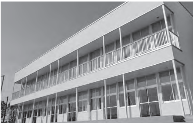
↑北部中学校校舎増築工事