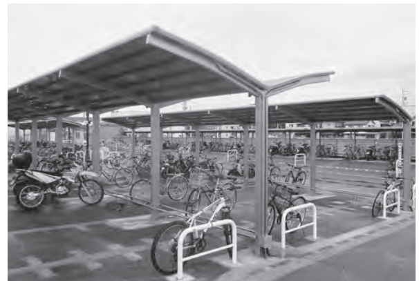
↑幸田駅前駐輪場改修工事