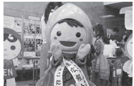
↑えこたんも人権広報大使として人権啓発活動に参加しています