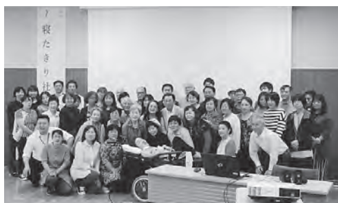
↑参加者全員で記念撮影