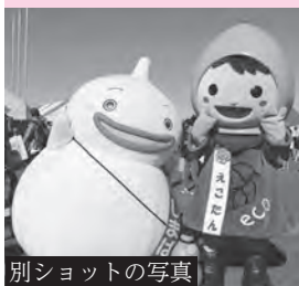
別ショットの写真

今月の表紙は、11月10日(日)にハピネス・ヒル・幸田で開催した幸田産業まつりの、えこたんとしまばらん(町と姉妹都市提携を結ぶ長崎県島原市のキャラクター)が仲良く並ぶ写真です。まつりの様子は1月号でお伝えします。