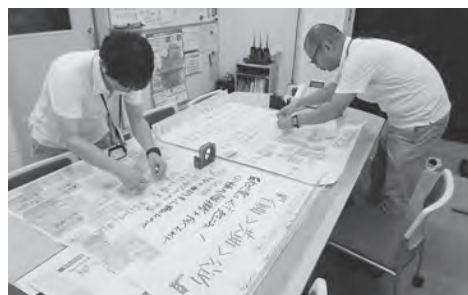
↑テラス準備室内での作業の様子

町では、いつ起こるかわからない災害に備える必要があることから、地域の安全を24時間見守る体制づくりとして、「幸田町安全テラスセンター24（以下「テラス」）の設置に向けたプロジェクトを推進しています。プロジェクトでは、テラスが、防災・減災について日常的に意識される機会や地域の防災を支える人々の交流・協力できる場を提供し、災害対策本部の準備的・補助的な役割となるような検討を進めています。プロジェクトを推進するにあたり、「みんなのテラス」を実施方針として、町民・学校・消防などに向けたワーキングを開催し、多様な参加者による多角的な検討をしています。また、ワーキングでいただいた意見・要望、課題を検証し、テラスのあり方や具体的な事業内容、事業形態について有識者で構成する「幸田町安全テラスセンター24設置専門委員会」で協議・検討をしています。プロジェクトは令和3年度の設置、本格運用を目指して準備を進めています。本年度は、テラス運営の基本方針についての検討を進めています。