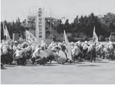
↑シェイクアウト訓練

9月7日㊤に防災広場で幸田町総合防災訓練を実施し、55機関、約800人が参加しました。いつ起きてもおかしくない南海トラフ巨大地震を想定し、参加者全員で行うシェイクアウト訓練を始め、災害救助犬検索・倒壊家屋救出救助訓練、LPガス・油火災訓練、緊急物資輸送訓練および炊き出し訓練などさまざまな訓練が実施されました。