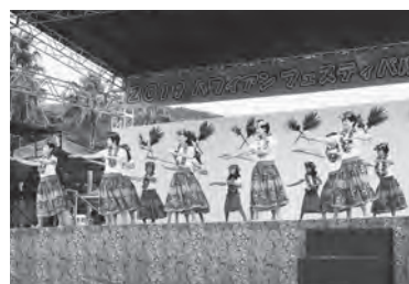
↑参加した町のグループ

幸田町と西尾市の海の見えるまち交流事業を推進するために、4月から生涯学習講座で学び始めたばかりのフラダンスグループが、西尾市で、8月28日⑩に開催された「ハワイアンフェスティバルin吉良ワイキキビーチ」に参加しました。当日は、町長が、幸田町特産の「梨」を抽選会で観客にプレゼントし、大変盛り上がりました。交流を通して隣の市との連携を深めていきます。