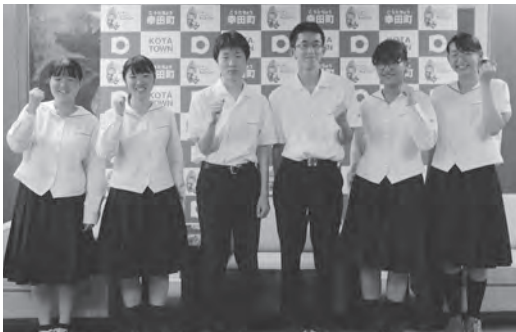
↑幸田高校文芸部の皆さん