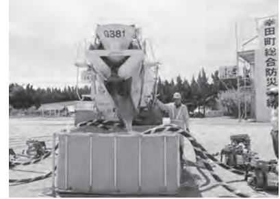
↑消防用水搬送訓練