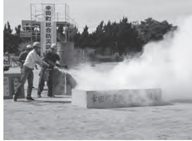
↑LPガス・油火災訓練