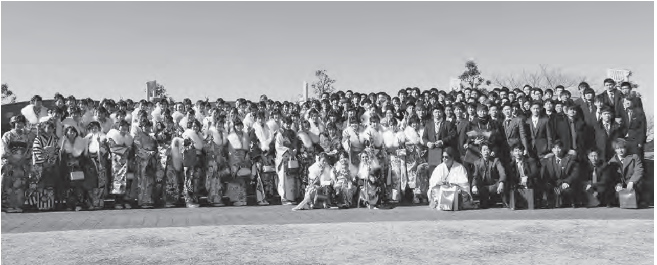
↑昨年度、第71回成人式の様子