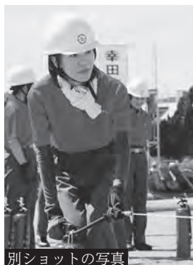
別ショットの写真