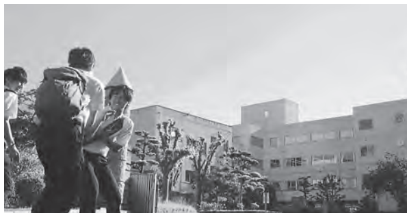
↑コンセプトムービーのワンシーン（ロケ地：北部中学校）

5月7日㊧、株式会社グローアップ「キミスカ」コンセプトムービーの撮影が北部中学校で行われました。実際のロケを間近で見て、様々なことを学ぶことができました。本作品はYouTubeからご覧いただけます。「キミスカ コンセプトムービー」で検索してください！