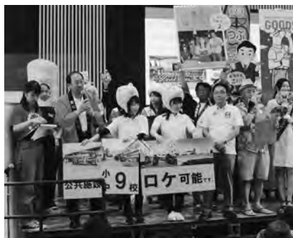
↑成瀬 敦町長による1分間PR