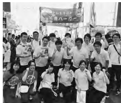
↑PRのため参加した職員