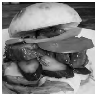
季節野菜と手作りソース