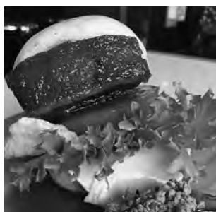
ガッツリ甘辛角煮と辛ミンチ飯ソース