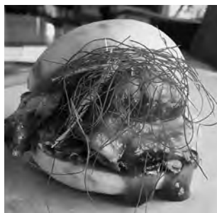
ソースたっぷり角煮