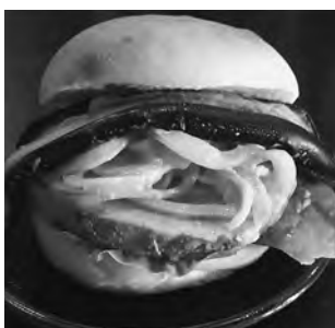
幸田が盛りだくさん