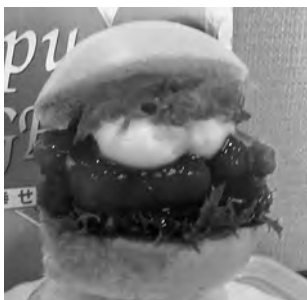
甘くて辛いヤンニョンソース