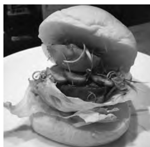
カレー風味角煮としっとり自家製パン