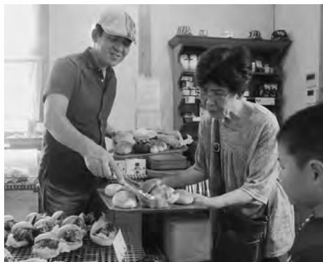
↑販売初日に幸田角煮バーガーを購入するお客さん（販売店：ダーシェンカ）

商工会と役場が共同で開発した新メニュー「幸田角煮バーガー」が8月24日④から町内8店舗で一斉に販売が開始されました。幸田町産の「夢やまびこ豚」を100グラム以上使用した角煮と、町内産野菜を使った各店舗オリジナルのハンバーガーです（商工会が設立した「幸田町うまいもん創作委員会」の認定を受けた店舗のみが販売できます）。参加8店舗がそれぞれ工夫を凝らし、オリジナリティあふれる味に仕上げ、食べ応え満点なものになりました。ぜひ各店舗の味を食べ比べてください。商工会ホームページにも「幸田角煮バーガー」が掲載されていますのでぜひご覧ください。 *販売日や価格については各店舗で異なるため、あらかじめご確認ください。