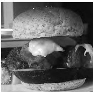
とろ〜りラクレットチーズ