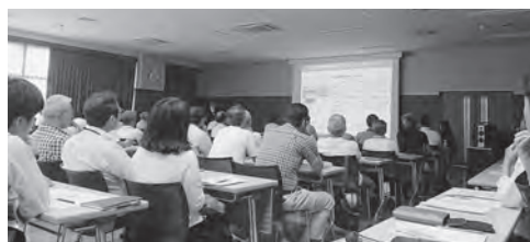
↑ロケツーリズムシンポジウムの様子

町では現在、ロケ誘致を積極的に行い、ご当地グルメの定着を目標に、商工会などと協力しながら新メニューの開発に取り組んでいます。8月24日㊿には新メニューの「幸田角煮バーガー」が町内で販売開始されました。詳しくは4ページをご覧ください。