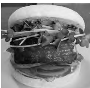
ザ・角煮 キ・セ・キのバーガー