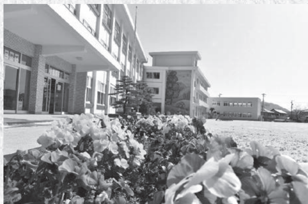
↑豊坂小学校の様子

昨年度、自慢の「ナス畑」とシンボル ツリーの「ハリギリ」をピオトープに移 設し、3月には真っ白な増築校舎「東