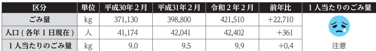
1人当たりのごみ量の推移

町指定ごみ袋の値下げにより、燃やすごみの量は怎么样了？ そんな疑問にお答えするコーナーです。