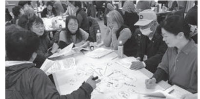
↑ケアマネジャーとの合同勉強会