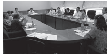
↑ふくし座談会の様子