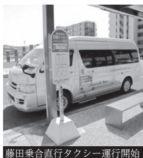
藤田乗合直行タクシー運行開始