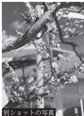
別ショットの写真