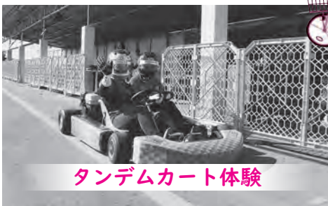
タンデムカート体験