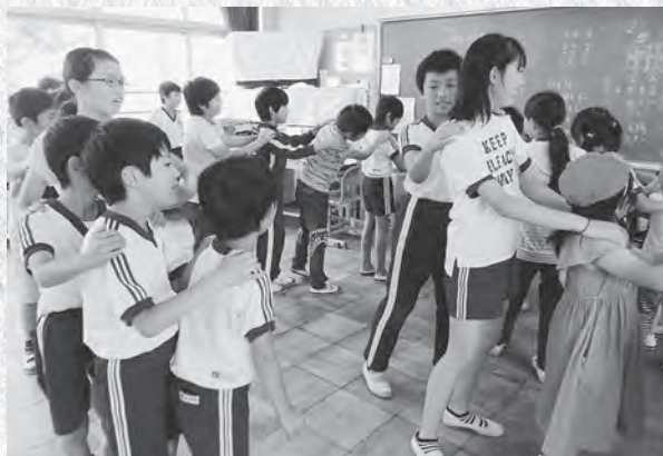
↑レクリエーションを楽しむ子どもたち

1年生から6年生までの児童約35人で構成される縦割り班は、全部で28班あります。縦割り班による遊びを通して、異