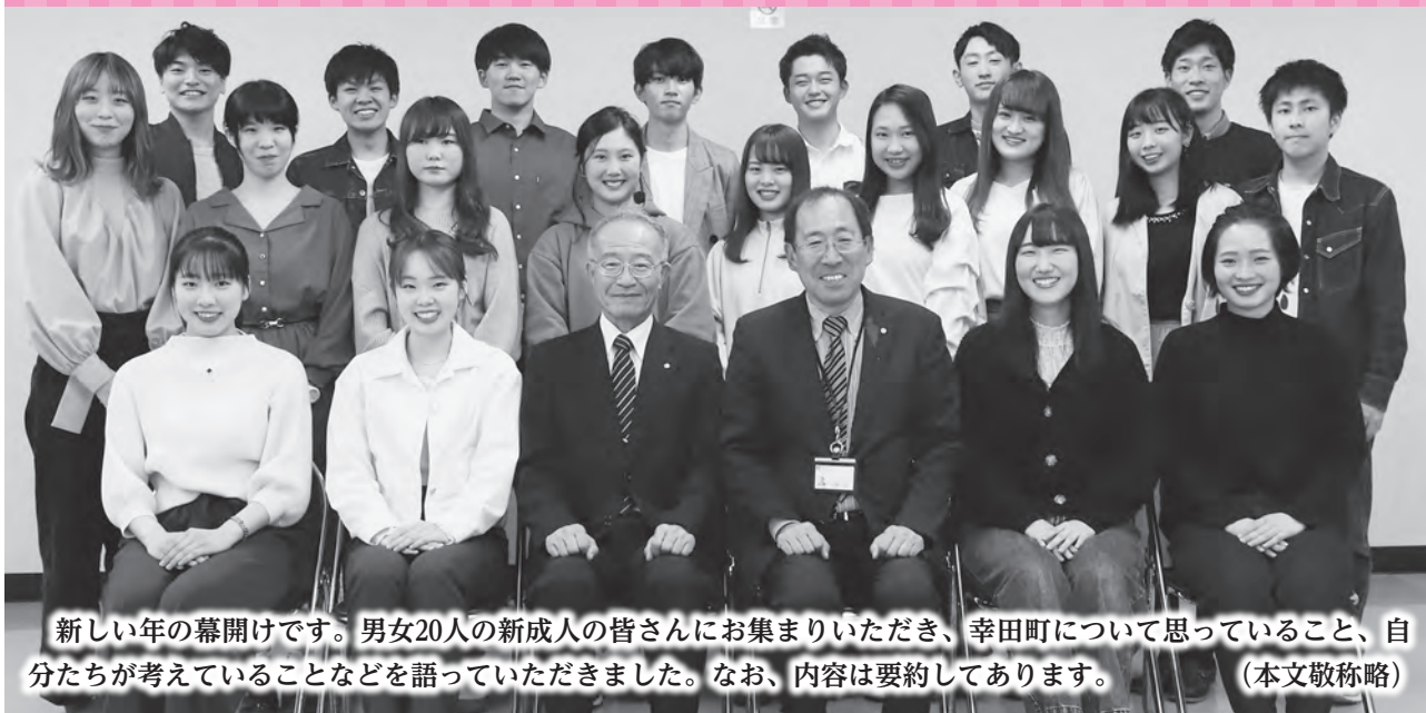
新しい年の幕開けです。男女20人の新成人の皆さんにお集まりいただき、幸田町について思っていること、自分たちが考えていることなどを語っていただきました。なお、内容は要約してあります。(本文敬称略)

町長 幸田町をより良いまちにするために、若い人の意見を聞いて、尊重していきたいと考えています。