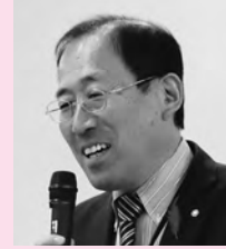
幸田町長 成瀬 敦