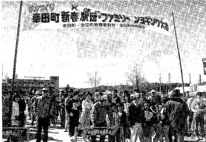
▲駅伝のスターティングメンバーを見送る