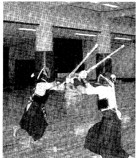
幸田中武道館での練習風景