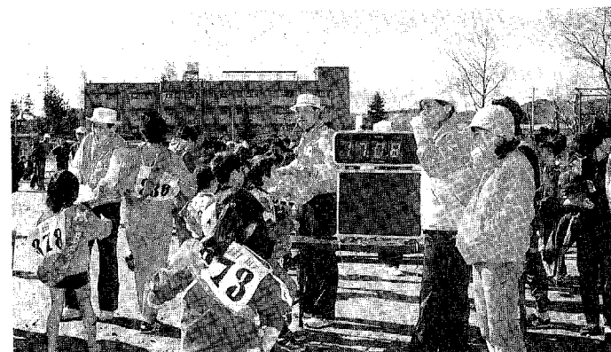
▲デジタル時計を見て自己タイムをチェック(ジョギング)