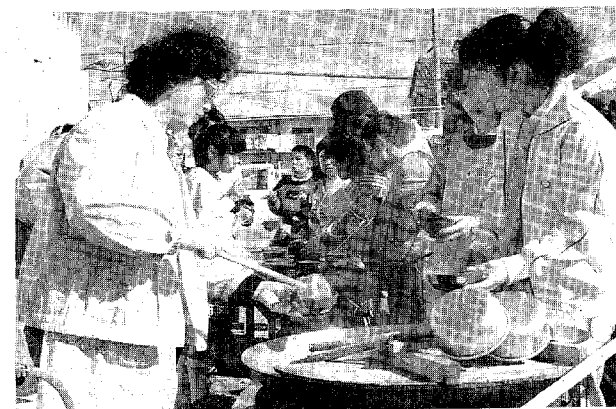
◀ 体協会員の作ったおしるこが完走の疲れをとる