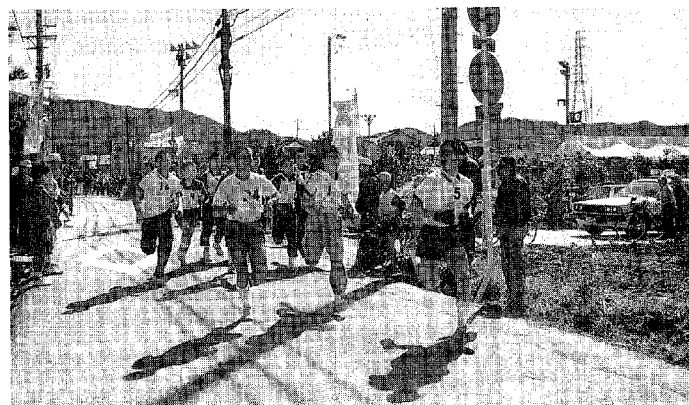
▲駅伝でスタート直後の選手