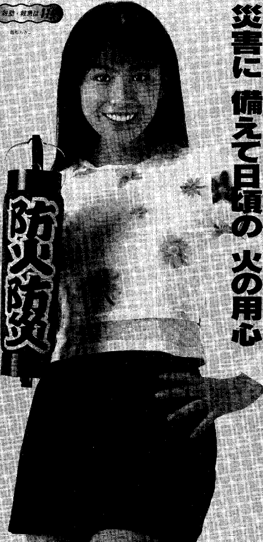
春の火災予防運動・3月1日～3月7日