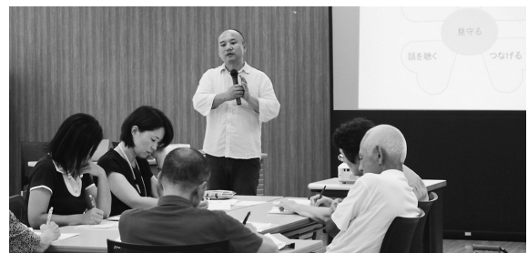
▲ゲートキーパー養成講座の様子

問合せ 福祉課福祉グループ ☎62-1111 (内線151) FAX56-6218