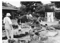
▲水遊びに参加する子どもたち