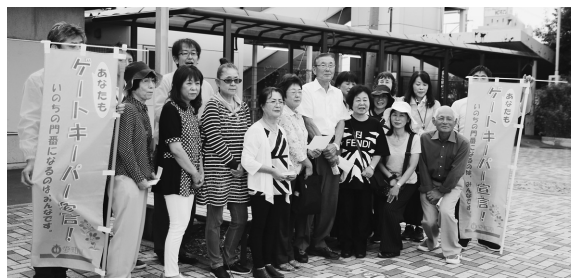
▲幸田町ゲートキーパーの皆さん