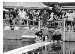
▲ゴザ走りで一生懸命走る参加者

問合せ 島原市しまばら観光おもてなし課 ☎0957-63-1111（内線214）