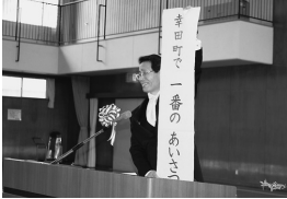
▲幸田町で1番のあいさつをと掲げる校長先生

過去2年間、校長より投げかけられた「あいさつ名人」をキーワードに、全校一丸となってあいさつ運動に取り組んできました。以前は、少し恥ずかしがっていた子