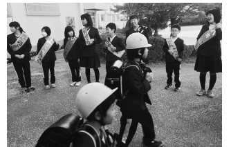
▲あいさつボランティア隊

どもたちも、次第に元気のよいあいさつを友達や教職員、来校される人に対してできるようになってきています。