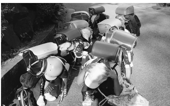
▲登校中のシェイクアウト

健康であることはもちろんのこと、まずはかけがえのないのちを守ることのできる児童を育てていきます。