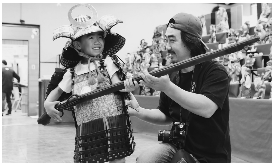
▲戦国武将みたいにかっこよくなれたね！

郷土資料館で季節展示「端午の節句」の期間中に、展示に合わせたイベントとして、鎧の試着会「戦国武将になりきってみよう」を行いました。子どもサイズから大人サイズの鎧まであり、お子さんだけでなく親子で試着する姿もありました。また、昔からの遊び道具なども展示されていました。