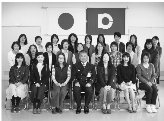
▲平成30年度幸田町女性消防クラブ員の皆さん