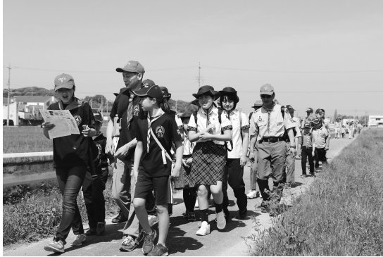
▲ハイキングで絆も深まります

幸田地区のボーイスカウトやガールスカウトがお互いの交流を深めるための活動として、第31回スカウトカーニバルin幸田が開催されました。町内の史跡や遺跡を歩いて回り、各ポイントに到着すると歴史クイズに答えて歴史を勉強しました。今回訪れた三村神社（長嶺）では普段は見ることのできない「欄間のうさぎ」を特別に見せてもらいました。