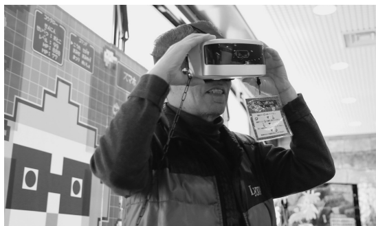
▲VRマップを楽しむ体験者