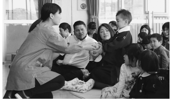
▲先生に初めて名前を呼んでもらえたよ！