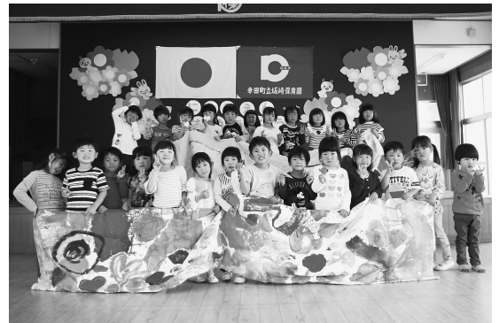
▲みんなの手作りこいのぼり