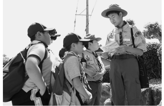
▲各ポイントでクイズに挑戦！