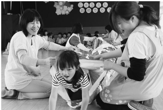
▲上手にくぐれました

坂崎保育園でこどもの日の集いを行いました。年少さんから年長さんまで集まって一緒に歌を歌いました。その後は、こいのぼりの中をくぐる遊びをしました。くぐることで元気な子どもに育つようにという願いが込められているそうです。こいのぼりは年長さんの手作りで、真っ白なこいのぼりに思い思いの色を塗って完成させました。