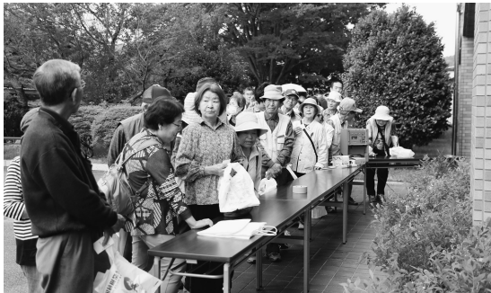
▲配布前から長蛇の列ができました

県下で一斉に行われる春の緑化推進運動の一環として、役場正面玄関で緑化木配布を行いました。配られたのはブルーベリーの苗木で、苗木をもらうために多くの人が列を作り、中には配布の1時間前から並んだという人もいました。配られた苗木は町内の緑化活動のために役立てられます。また、同時に緑の募金運動も行いました。