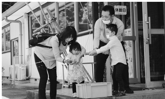
▲水鉄砲を楽しむ親子