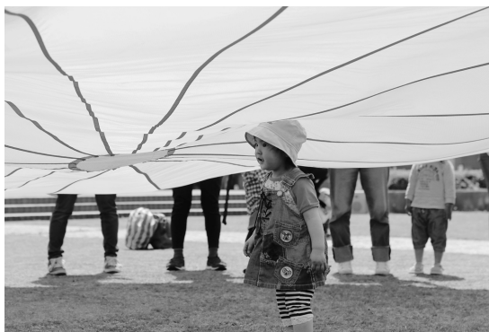
▲パラバルーンの中に入れたよ！