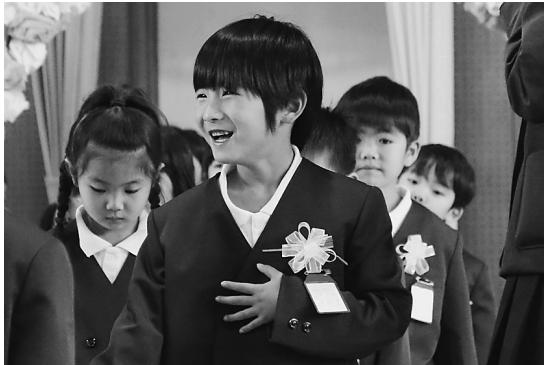
▲胸はドキドキ、心はワクワク！

町内の小学校で入学式を行いました。深溝小学校では、59人が新1年生となりました。花のアーチをくぐる1年生は、緊張しながらも学校生活にワクワクしている表情が見られました。式を終えた教室では、先生が紙芝居や絵本の読み聞かせをしてくれました。先生が保護者や1年生に学校の説明をし、最後は天井に付けてあったお祝いのくす玉を割ると、中からプレゼントが出てきました。1年生はとてもうれしそうな表情を浮かべていました。