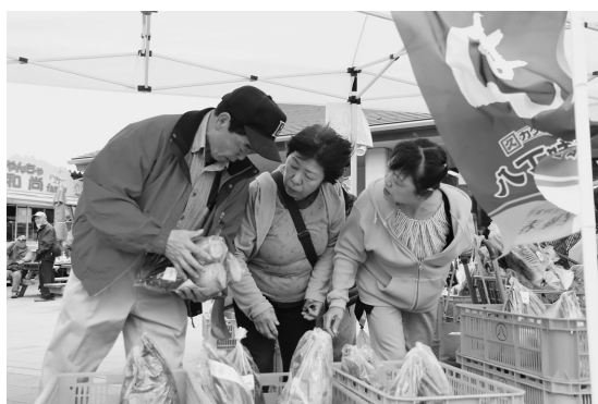
▲タケノコの品定めをします