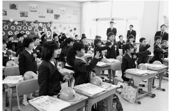
▲じゃんけん大会をしました