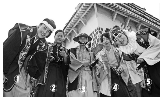
～武将隊メンバー紹介～