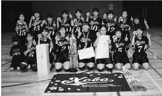
▲女子の部優勝 野場子ども会

平成30年11月4日(日)にデンソー幸田製作所体育館で子ども会ドッジボール大会が開催され、白熱した試合が繰り広げられました。女子の部の優勝は野場子ども会、準優勝は大草子ども会でした。また、男子の部は深溝学区子ども会が優勝しました。