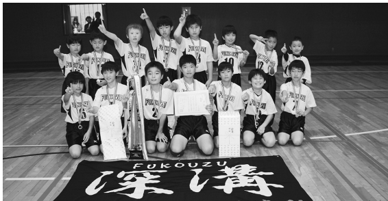
▲男子の部優勝 深溝学区子ども会