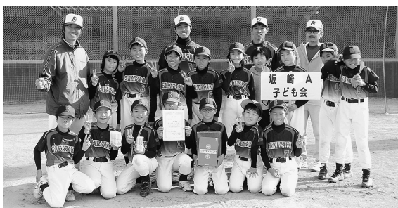
▲第3位 坂崎A子ども会