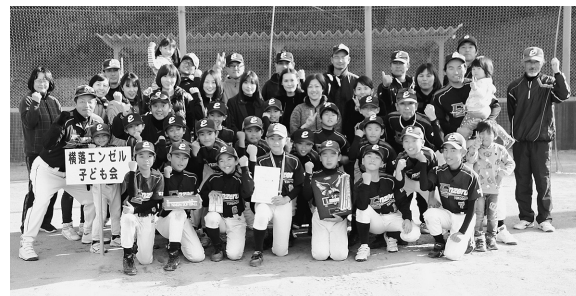
▲準優勝 横落エンゼル子ども会