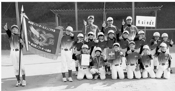
▲優勝 K s i e g ' z

平成30年11月18日(日)、25日(日)にとぼね運動場でソフトボールジュニア大会が開催されました。5年生以下の新チームとなって初の大会です。優勝はK s i e g ' z (高力子ども会)、準優勝は横落エンゼル子ども会、3位は坂崎A子ども会でした。