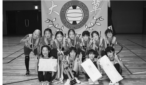
▲女子の部準優勝 大草子ども会