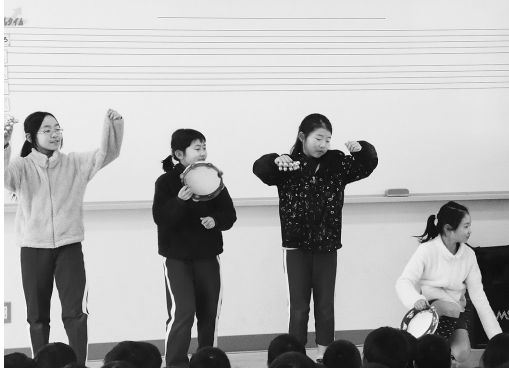
▲歌と楽器の演奏（昨年度）

幸田小学校の子どもや職員が楽しみにしている恒例イベントの一つ、「スプリングコンサート」が、毎年