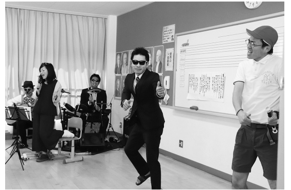
▲教員有志のバンド演奏（昨年度）

2月下旬から3月上旬にかけて、連日第一音楽室において開催されます。スプリングコンサートを主催するのは歌声委員会、参加するのは「幸田小学校の子どもと職員」の中の希望者、観覧は誰でも自由となっています。