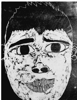
「いたみをこらえているかお」 【木版画】

日々の中で仲間や下級生との心地よい時間を過ごしています。昨年度は、ピアノ独奏、カステタネットやタンブリンなどの手持ちの楽器を持って体を動かしながらの歌、木魚を用いた「おきょう」など、趣向を凝らした38組の出演者による演奏が披露されました。最終日の大トリ、教員有志バンド「わんこスター」による「さくらんぼ」の演奏で、はじける笑顔と手拍子の中、大盛況で幕を閉じました。 歌うことや演奏することが大好きな子ども、演奏を聴いて友達の新たな良さを知る子ども。どちらも笑顔あふれるスプリングコンサートの開催が、今年度ももうすぐです。