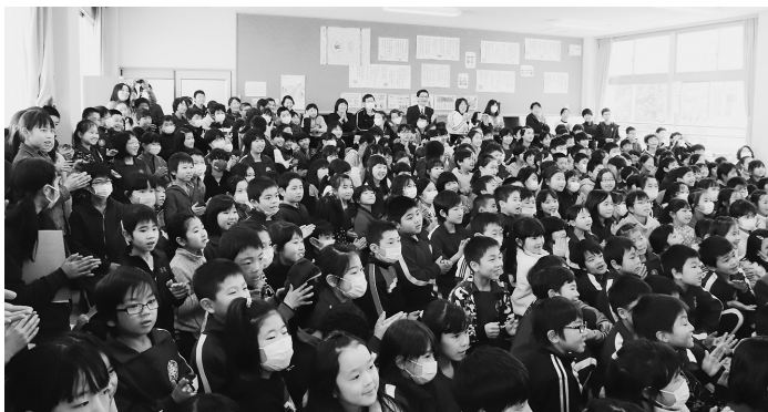
▲大盛況の最終日（昨年度）

日々の中で仲間や下級生との心地よい時間を過ごしています。昨年度は、ピアノ独奏、カステタネットやタンブリンなどの手持ちの楽器を持って体を動かしながらの歌、木魚を用いた「おきょう」など、趣向を凝らした38組の出演者による演奏が披露されました。最終日の大トリ、教員有志バンド「わんこスター」による「さくらんぼ」の演奏で、はじける笑顔と手拍子の中、大盛況で幕を閉じました。 歌うことや演奏することが大好きな子ども、演奏を聴いて友達の新たな良さを知る子ども。どちらも笑顔あふれるスプリングコンサートの開催が、今年度ももうすぐです。