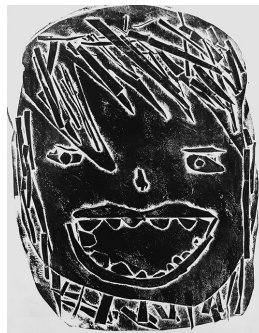
「にこにこにこ」 【紙版画】

先生から 髪の毛の1本1本まで、ていねいに彫ることができました。痛みに耐える苦しそうな表情をととてもよく表せています。