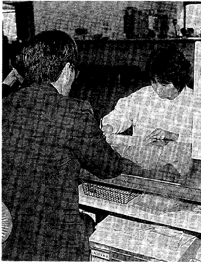
▲住民課・税務課では、昼休みも証明事務を行っています。

幸田町は、土曜閉庁によって住民のみなさんへの行政サービスが低下しないような対応をしています。