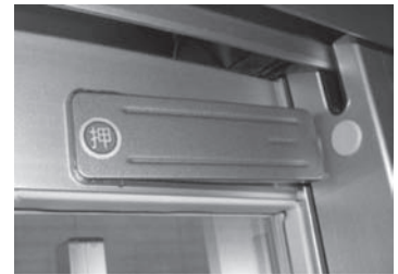
補助錠を活用し、ツーロックにすることでさらに安全性が確保されます。