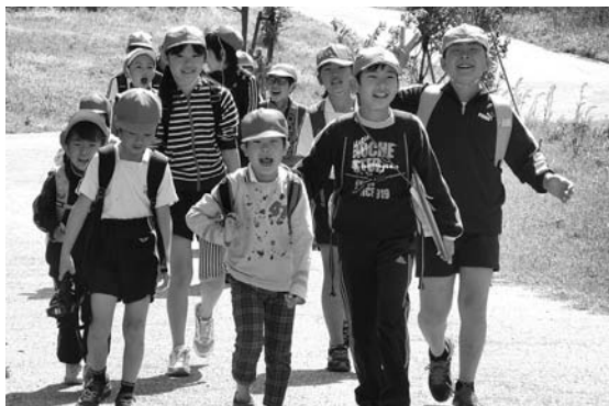
仲良くチェックポイントを通過

今回は、4月25日に実施した春の遠足について紹介します。1年生がこの荻谷小学校に入学し、歓迎の気持ちとともに、学区の自然に触れながら、チームの親睦を深めることを目的にして実施します。執行委員会による始めの会を終え、班で写真を撮った