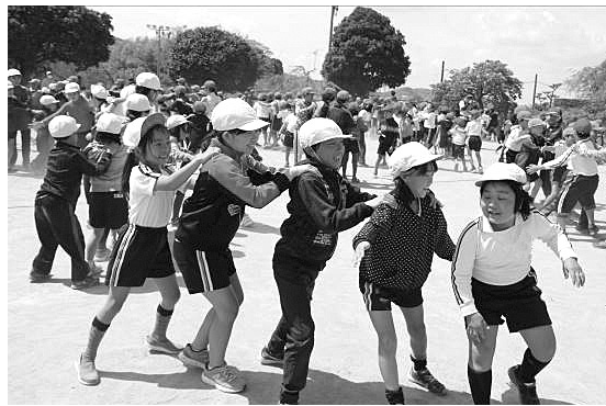
とかげのしっぽを楽しむ児童たち

高学年の子どもたちが、交通安全やあいさつを呼び掛けたり、また、楽しく歩けるように班のみんなに声を掛けたりしてくれます。時には小さい子の荷物を持ってあげたり、「もう少