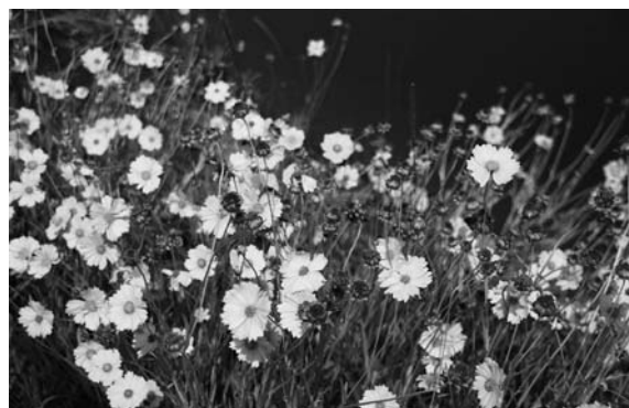
特定外来種の「オオキンケイギク」