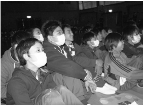
スライドショーを見る6年生たち

坂崎小学校は、町内で一番小さな小学校ではありますが、この六年生を送る会からも分かるように、学年の枠を越えた縦のつながりの強さは町内でもトップレベルです。今後もこの絆を大切に、新六年生を中心に、縦のつながりをもっと強くしていきたいものです。