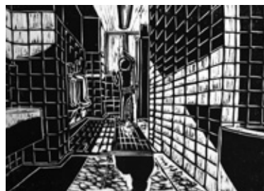
「トイレの窓を開ける」 【版画】

先生から 左の窓の線をしっかり描くことで、奥行きを表現できています。ピアノを弾く人物の描き方も良いですね。