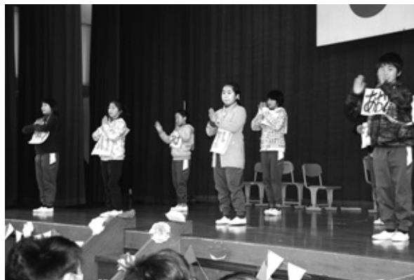
恋ダンスを踊る5年生たち

生にちなんだクイズ、四年生は、六年生のあこがれているところを叫び、五年生は、今、流行りの恋ダンスを、寸劇を交えて踊りました。やはり、流行りの恋ダンス。音楽が鳴り始めると六年生たちが口ずさみながら、一緒に踊り出しました。元気があり、ノリのよい六年生を在校生は越えていきたいものです。