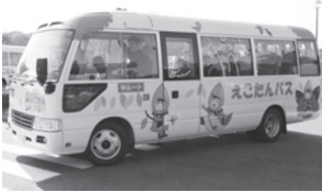
コミュニティバス(えこたんバス)