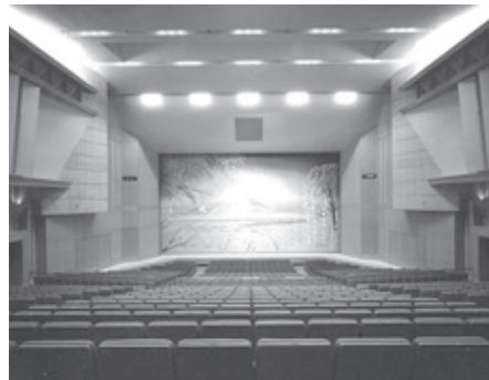
町民会館さくらホール