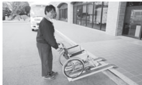
▲役場正面玄関にある車いすとスロープ

役場正面玄関に車いすをご用意しています。ま た、玄関の段差解消のためハンディスロープもあり ます。総合窓口案内にお声掛けいただければ、お手 伝いさせていただきますので、遠慮なくお申し出 ください。