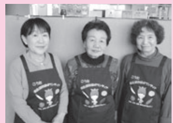
こうた食生活改善ボランティアの皆さん