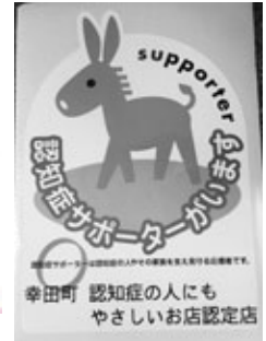
「認知症の人にもやさしいお店」ステッカー