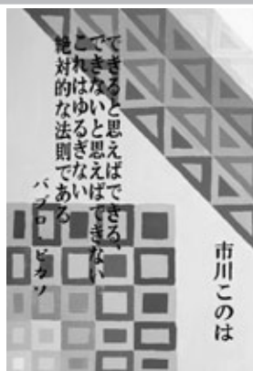
「やればできる」 【デザイン画】