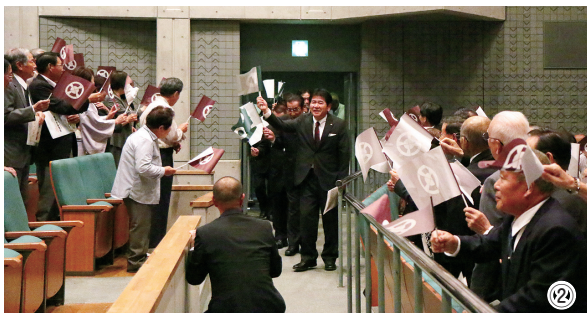
島原市・幸田町 姉妹都市提携書

10月11日(水)、幸田町で初めてとなる姉妹都市の提携を長崎県島原市と結びました。調印式は町民会館つばきホールと島原市有明総合文化会館で同日同時刻に開催。両会場をインターネットでつなぎ、ライブ中継でお互いの会場の様子をスクリーンに映し出して行いました。また、肥前島原子ども狂言と中央小学校三河万歳クラブによる「七福神の舞」が披露され、末永い友好交流の主役となる子ども同士の交流を行いました。