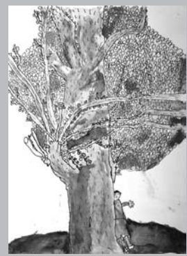
「木にかくれているぼく」 【水彩画】

全校に向かつて呼び掛けた言葉の一部です。2学期はそれぞれの行事、日常生活で北部中が一つになって熱く盛り上がっていくものと思います。これらの行事は公開していますので、保護者はもちろん地域の皆さまにもぜひご覧いただきたいと思います。