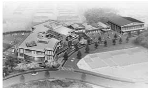
▲「岡崎市子ども発達センター」のイメージ図

問合せ 子ども発達センター準備室 ☎23-7067 福祉課 福祉グループ(内線151)