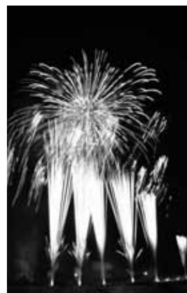
▲刈谷わんさか祭り（花火大会）