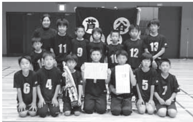
▲男子の部優勝の芦谷子ども会