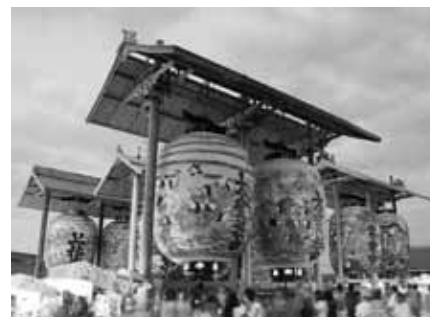
▲三河一色大提灯まつり

問合せ 三河一色諏訪神社 ☎0563-73-4276、西尾市商工観光課 ☎0563-65-2170