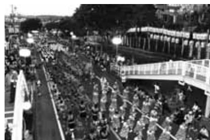
▲三好いいじゃんまつり