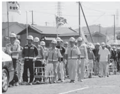
▲昨年の防災訓練の様子

内容 発生が危惧される南海トラフ巨大地震に備えた訓練です。各行政機関、民間企業、自主防災会、ボランティア団体および一般住民が総ぐるみで、総合的かつ実践的な防災訓練を実施し、地震・災害時における早期対応、相互協力体制の確立および住民の防災意識の高揚を図ります。多くの人のご参加をお願いします。