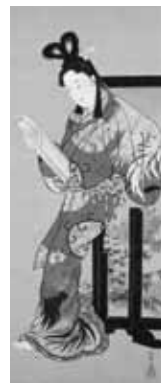
▲河鍋暁斎「文読む美人」 （河鍋暁斎記念美術館蔵）