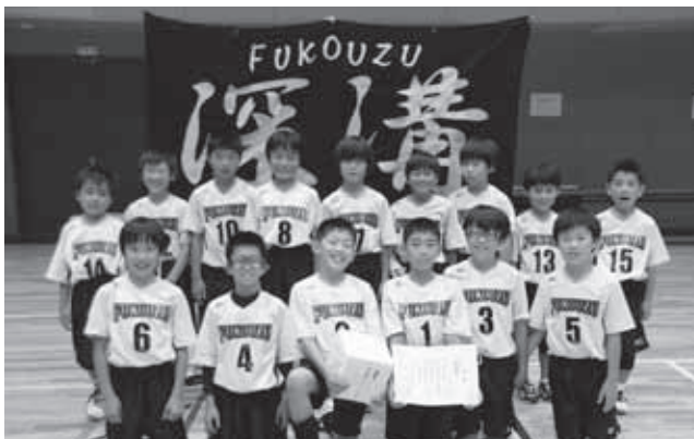
▲昨年西三ドッジ本大会男子の部優勝の深溝学区子ども会