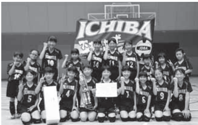
▲女子の部優勝の市場ジャイアント子ども会