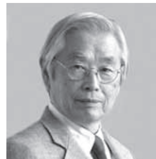
いじま すみお 飯島 澄男 氏

【ホームページ】プレステージレクチャーズ申込みよりお申し込みください。 http://2015kmrc.weebly.com